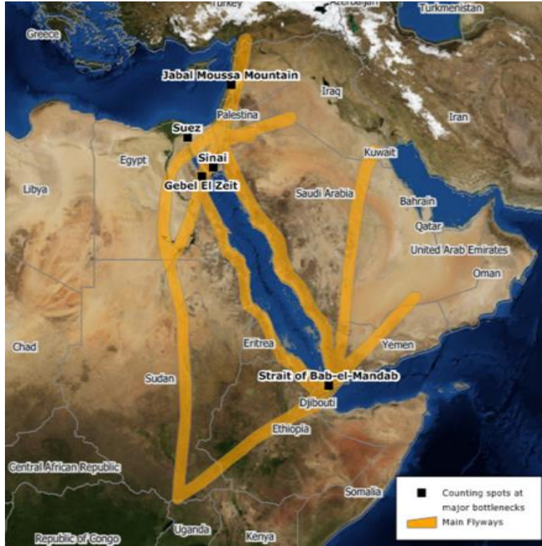
الشكل 2. المسارات الرئيسية التي تستخدمها الطيور الحوامة المهاجرة كجزء من مسار هجرة الطيور على الوادي المتصدع بالبحر الأحمر (2020 BirdLife)