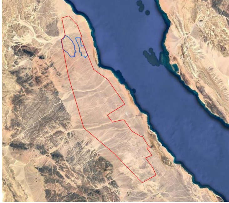
الشكل 1: موقع المشروع (باللون الأحمر) جزء من المنطقة المنصوص عليها - بموجب المرسوم الوطني - المخصصة لتطوير مزارع الرياح (الاستشاري _ 2019)